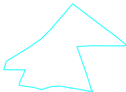
Projektētās teritorijas shēma pirms zemes ierīcības projekta izstrādes