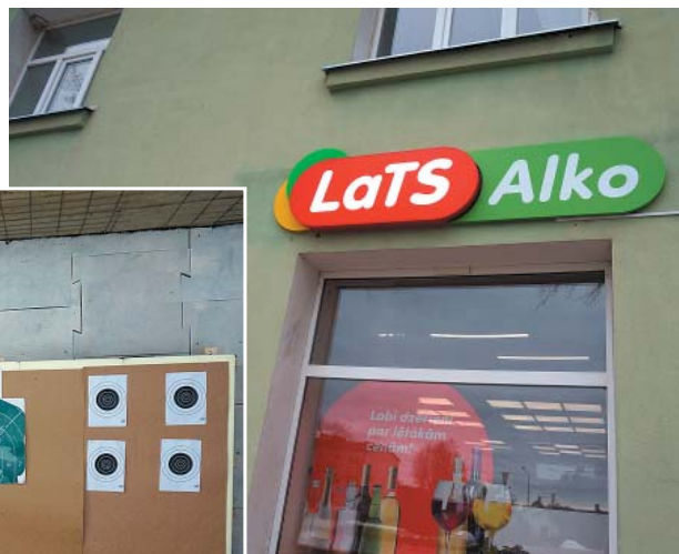
„Alko Lats” veikals.

Uzņēmumā ļoti apzinīgi savus pienākumus veic 19 darbinieki.