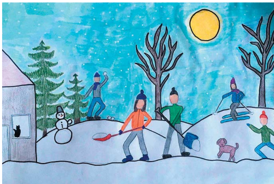
Laimas Melnes darbs.

Latviešu valodas aģentūras konkursā 2020./2021. māc. g. „Mans grāmatplaukta stāsts” Varakļānu vidusskolas 10. klases skolēns Dairis Upenieks 10. – 12. klašu zīmējumu grupā ir ieguvis 2. vietu (sk. Margarita Selicka) un 1. – 4. kl.